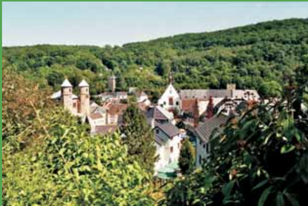
Blick auf Bad Münster-eifel

Die nähere und weitere Umgebung lädt zu ausgedehnten Fuß-, Auto-, Bahn- und Radwanderungen ein und bietet einfach herrliche Ausblicke.